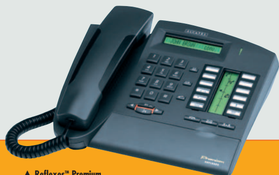
▲ Reflexes™ Premium