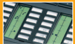
▲ Etiquetas que puede personalizar. Amplias teclas transparentes

Las teclas programables del sistema o de usuario están disponibles en Alcatel Reflexes™. Las etiquetas se pueden estandarizar a nivel corporativo y/o puede definir las del usuario. Determinar el estado de una llamada es sencillo con la ayuda de los iconos de fácil comprensión que reemplazan a las confusas combinaciones de LED. La etiqueta asociada a cada tecla se lee fácilmente porque la parte superior está equipada con una lente integrada que aumenta el tamaño de las letras. Esta parte superior de la tecla está patentada como característica Alcatel.