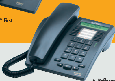
▲ Reflexes™ Easy