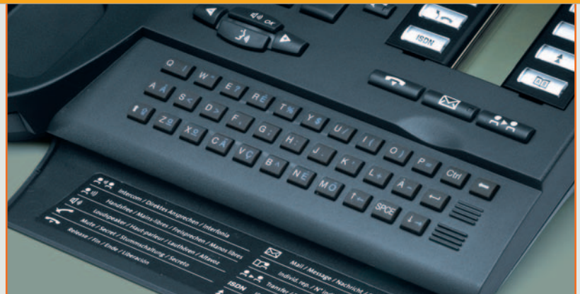
▲ Teclado alfanumérico

Alcatel Premium y Advanced Reflexes™ están equipados con un teclado alfanumérico. Este elemento permite acceder al directorio de la compañía para la "llamada por nombre" y los servicios de "mini-mensajería de texto".