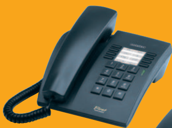
▲ Reflexes™ First