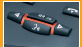
▲ Teclas de control de audio

Las funciones de control de audio (volumen del altavoz, control de audio en manos libres, secreto, etc.) están separados de las teclas de función del sistema para facilitar un control de audio sencillo y claro para el usuario.